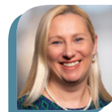
Diana Stolz, MdL

Diana Stolz, MdL Hessische Ministerin für Familie, Senioren, Sport, Gesundheit und Pflege